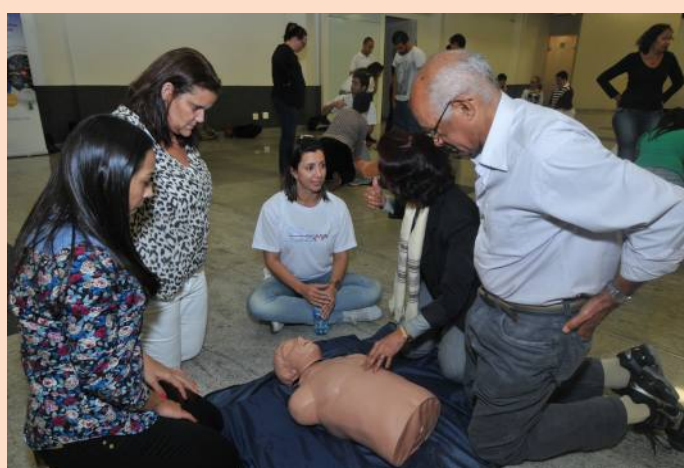
Os alunos ouvem atentos às orientações dos instrutores da Somiti

COMUNICADO DA ASSOCIAÇÃO MÉDICA BRASILEIRA